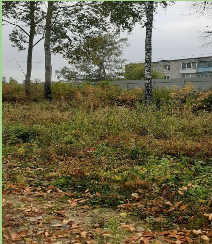
Рельеф – спокойный, ровный.